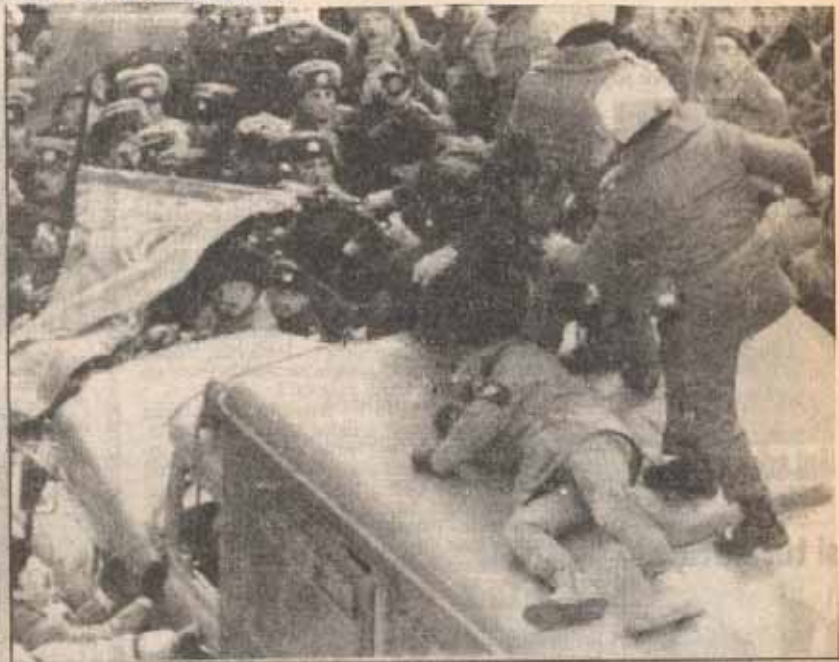
Moskova'da dün Kızıl Ordu'nun kuruluş yıldönümü münasebetiyle düzenlenen dev gösteride çatışma çıktı. Miğferli ve coplu Rus polisi eski günlerin özlemini çeken göstericileri sindirmek için ter döktü.

Sovyetler Birliği'nde iktidar mücadelesinin sürdüğü ve komünistlerin bu mücadelede tavırlarını yeni yeni koymaya başlayacağını, Devrimci Emek okurları dergimiz sayfalarında sıkça okumuşlardır. Bugünlerde Sovyetler Birliği'nin başta Moskova ve Leningrad olmak üzere çeşitli kentlerinde yaşananlar, Devrimci Emek'in tespitlerini doğruluyor. Son günlerde Sovyetler Birliği'nin bir çok bölgesinde açık kitle gösterileri yapılmaya başlandı. Bizim bu tespitlerimiz, Sovyetler Birliği'nde 70 yıl dan beri yaşanan sosyalizmin artık bir politik iktidar yapısı olmanın çok ötesinde, toplumsal ekonomik yapıya da egemen olmuş, üretim ilişkilerini belirleyen, yeni insanın şekillenmesine doğrudan etki eden bir sistem haline dönüşmüş bulunmasından kaynaklanıyordu. Ve demiştik ki; Toplumların belirleyeni ekonomik alt yapı ise -ki öyledir.- bugün üst yapı kurumlarından biri olan hükümet kapitalist anlayışı savunsa bile, bunun başarı şansı yoktur, çünkü alt yapıda kolektif