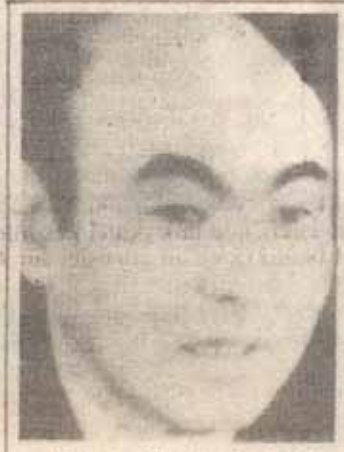
Askar Akayev, Türki

BIŞKEK — Kırgızistan Devlet Başkanı Askar Akayev, "Demokrasiden ve serbest pazar ekonomisinden taviz vermeyeceğiz" diyor. Akayev'e göre de (Kazakistan lideri Nazarbayev'de olduğu gibi) Türkiye; ekonomisi, laik bir ülke oluşu ve