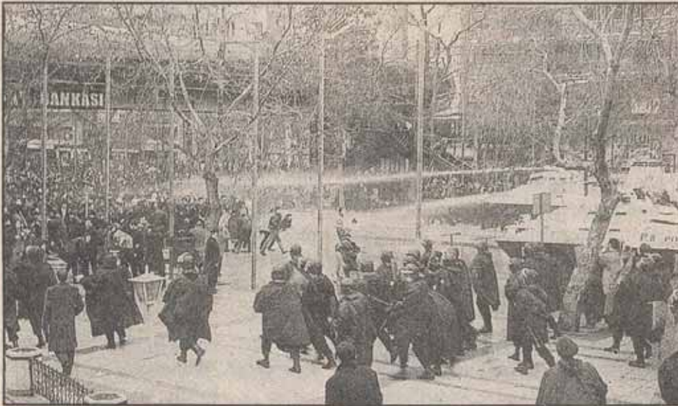
İhanet cephesinin engellemeleri, kitlelerin önünde set olması devrimin zafere ulaşmasını önleyemeyecektir.

Hiç utanmadan, kendilerine "devrimci", "sosyalist", "ilerici" diyen bu hainler, işçileri bakanına çiçek sunarken, o sırada devrimciler, aynı bakanın emriyle işkence görüyorlardı. Halk düşmanı katiller sürüsünün başına geçip, devrimcilere yönelik açık infazları yöneten bu faşist bakana çiçek sunmak, devrimcileri susturmaya kalkmak, öldürülen insanlarımızı karşı işlenmiş ağır bir suçtur. Gazi ve Ümraniye sokak savaşları sırasında, eylemleri, anti-faşist gösteriye dönüşecek diye, eylemi erteleyerek devleti içine düştüğü zor durumdan kurtarmak, halka karşı işlenmiş en ağır suçtur. Halkların cellâdı CHP'yi, halk düşmanı faşist MHP'yi Kurultaya davet etmek, devletin yanında yer almaktır. Reformistler, halkların isyan ve ayaklanmasının önünde barikat olmakla kalmıyor, emekçilere karşı, burjuvazi ile birlik oluyorlar. Siz bütün dönemler, sermayenin önünde onur-