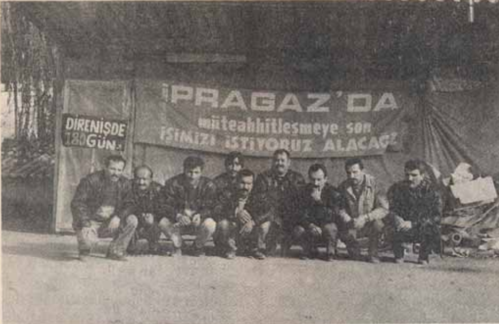
18 Ocak 1998