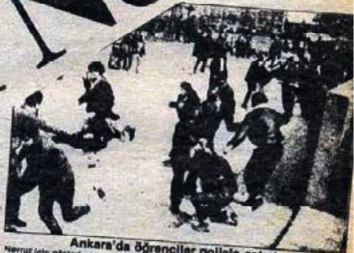
Ankara'da öğrenciler polislerle çatıştı