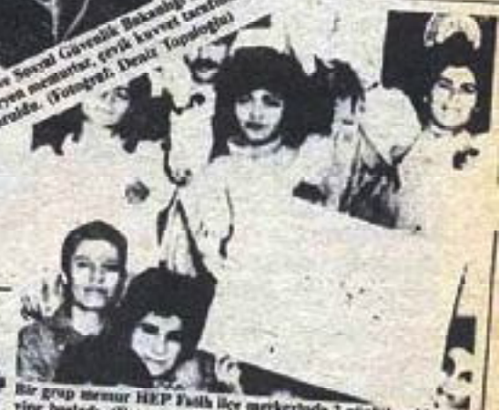
Bir grup memur HEP Faaliyetler merkezinde 2 günlük açlık grevine başladı.

dan Çalıpın ve Servis Güvencesi Bakanlığı Bölge Müdürlüğü yürütmek isteyen memurlar, çevik kurvet tarafından zorlaştırıldı.