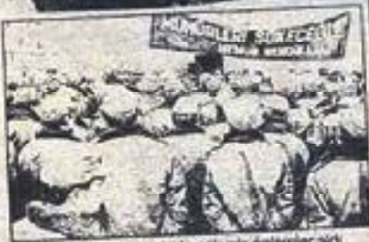
Çevik Kurvet olay yerinde çok sıkı önlemler aldı.

İstanbul Anadoluhisari Belediye binası önünde dün saat 14.00 sıralarında toplanan Tüm-Bem-Sen, Sağlık-Sen, Eği-Sen, Tüm-Sağlık-Sen ve Kam-Sen'e üye yaklaşık bin kişiden oluşan memur topluluğu sloganlar okuyarak binadan çıkarak yürümek istedi. Olay yerine gelen Çevik Kurvetler, memurların bu yürüyüşüne izin vermedi. "Sendikal mücadelemiz engellenemez" "Baskılar bizi yıldıramaz", "Sendikal mücadelemiz engellenemez", "Mühürleri sökeceğiz" yazılı pankartlarla yürüyün kalabalığının özü Çevik Kurvetler tarafından kaldırıldı. Belediye binasının üst katlarından kalabalığın üzerine taşlar ve su şişeleri atılması üzerine çatışma çıktı. Birçok kişi yaralandı, 20 kişi de gözaltına alındı. ■ Memur YENER, Ramazan TÜMCÜLLÜ