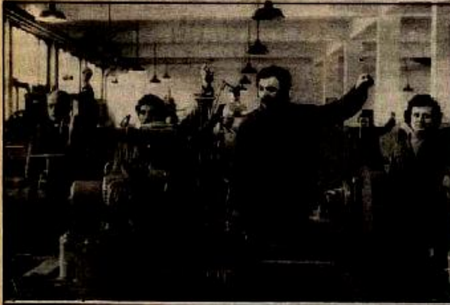
12 Eylül öncesi DİSK, Kabraman Maraş Katliamını Protesto Eyleminde.

Diğer konuşmacıların tümü DİSK'in geçmişte sahip olduğu tüm Devrimci değerlere, mücadele anlayışına ve Sosyalizmi inkara, hatta ona doğrudan saldırıya başladılar. Kongre, sosyal demokratların, sosyalistlerle kaba-