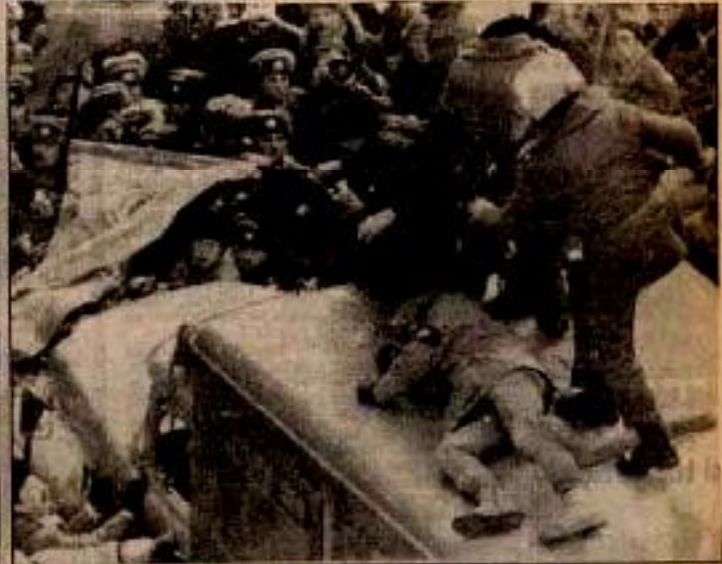
Moskova'da dün Kızıl Ordu'nun kuruluş yıldönümü münasebetiyle düzenlenen dev gösteride katılan çktü. Mğnerl ve copu İbu yollu eski gñzlerin İstemleri pekun gñstericileri dñmlmek İçin ter dñctü.

Sovyetler Birliđi'nde iktidar mücadelesinin sürdüđü ve komünistlerin bu mücadelede tavırlarını yeni yeni koymaya başlayacağını, Devrimci Emek okurları dergimiz sayfalarında sıkça okumuşlardır. Bugünlerde Sovyetler Birliđi'nin başta Moskova ve Leningrad olmak üzere çeşitli kentlerinde yaşananlar, Devrimci Emek'in tespitlerini doğruluyor. Son günlerde Sovyetler Birliđi'nin bir çok bölgesinde açık kitle gösterileri yapılmaya başlandı. Bizim bu tespitlerimiz, Sovyetler Birliđi'nde 70 yıl dan beri yaşanan sosyalizmin artık bir politik iktidar yapısı olmanın çok ötesinde, toplumsal ekonomik yapıya da egemen olmuş, üretim ilişkilerini belirleyen, yeni insanın şekillenmesine doğrudan etki eden bir sistem haline dönüşmüş bulunmasından kaynaklanıyordu. Ve demiştik ki: Toplumların belirleyeni ekonomik alt yapı ise -ki öyledir. - bugün üst yapı kurumlarından biri olan hükümet kapitalist anlayışı savunsa bile, bunun başarı şansı yoktur, çünkü alt yapıda kolektif