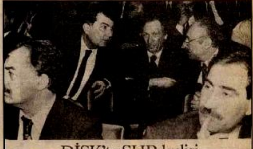
DİSK'te SHP lülesi

Basın-İş ve Yeraltı Maden-İş sözcülerinin dışındaki bütün ko-