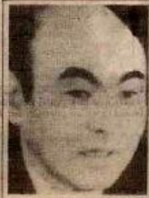
Askar Akayev, Türkiye

BIŞKEK — Kırgızistan Devlet Başkanı Askar Akayev, "Demokrasiden ve serbest pazar ekonomisinden taviz vermeyeceğiz" diyor. Akayev'e göre de (Kazakistan lideri Nazarbayev'de olduğu gibi) Türkiye; ekonomisi, lafık bir ülke oluşu ve