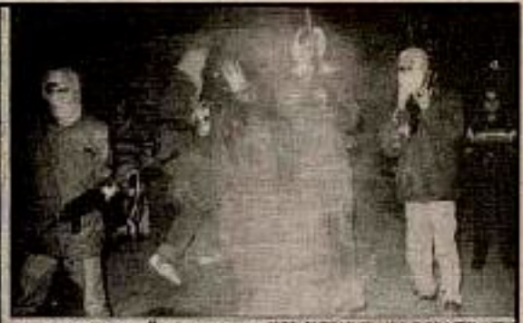
KAMLI MEYRIZ BÖYLE BAŞLADI Halkın birliği kutlamaları katılan PKK militanları, yabancının gözleri önünde Aralık'ta Dicle çarşısını aradılar. Aynı zamanda aynı askeri için milliyetçi partinin önderi olan Demirel'in çığ oluyordu. PKK bu deni rakibini Kalkınmış ve gelişmiş gibi göstermek istiyordu.