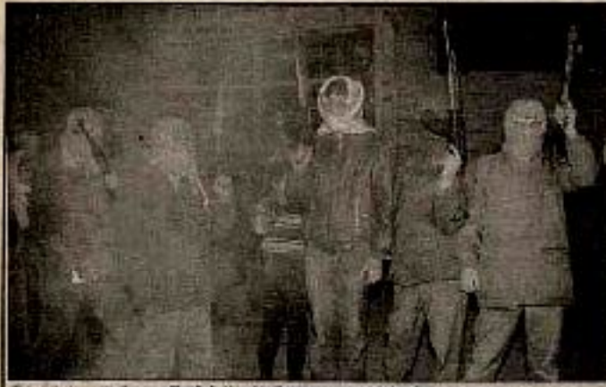
Terroristler halkın arasına gizleniyor PKK askerleri, Aralık'ta Dicle çarşısını bir yabancının gözleri önünde aradılar. Aynı zamanda aynı askeri için milliyetçi partinin önderi olan Demirel'in çığ oluyordu. PKK bu deni rakibini Kalkınmış ve gelişmiş gibi göstermek istiyordu.