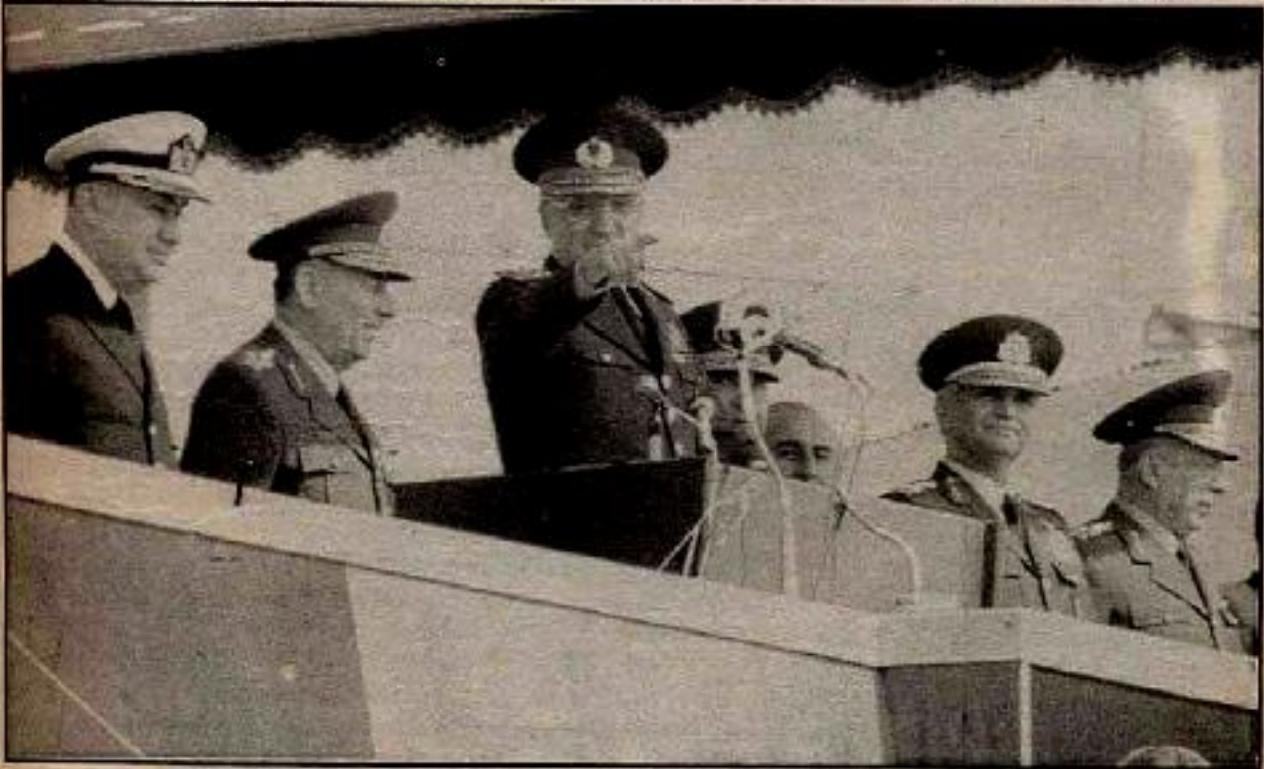
12 Eylül darbesini yapan cuntacı generallerin beşi birlikte

Bir yandan gerçekleşen devrimler ve yükselen devrimci mücadeleler, bir yandan sistemin içine düştüğü yapısal kriz, emperyalist sermayeyi büyük bir korkuya itti. Sıkışan sermaye, gerici siyasal terâhlere döndü; faşizm, militarizm ve anti-komünizm alabildiğine tirmandırdı. "Tarihsel bir hata" olarak gördüğü Sovyetler Birliği'ne ve sosyalist sisteme karşı, "uluslararası terörizm", "insan hakları", "demokrasi" terâhleriyle bir karşı atağa geçerek, yeni bir soğuk savaş dalgasını yükseltti. Her geçen gün daha da tirmanan, bu gün bile devam eden militarist ve saldırgan politika-