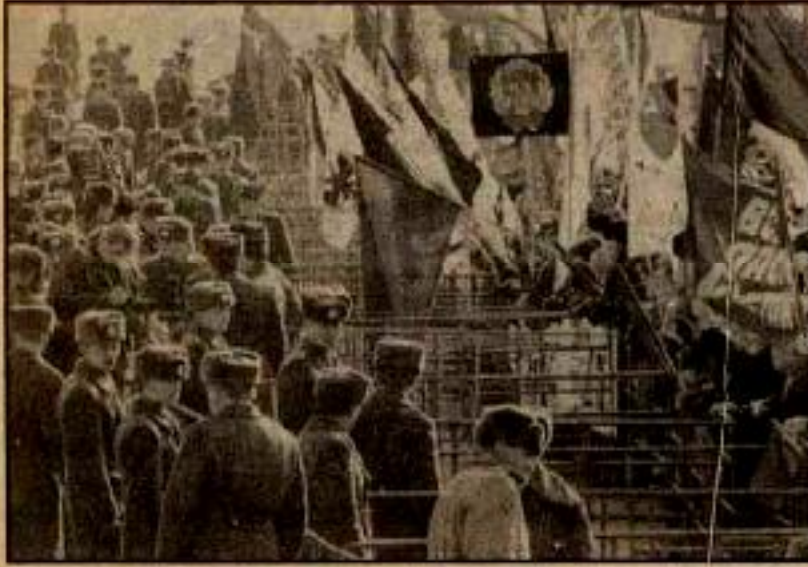
Parlamento önündeki komünistleri bugün durduran barikatlara yakında durduramayacak.

mamen aşma savaşı verirken, bir taraftan da bir üst evresi olan komünist evrenin maddi ve teknik temellerini oluşturur. Eski ile yeni arasında kıyasıya bir mücadele devam eder. Burada proletarya Ortodoks'ça proletarya diktatörlüğüne başvurur. Gene bunun içindir ki, proletarya diktatörlüğü politik geçiş döneminin tümü boyunca önemini korur. Sosyalist güçler, yalnızca içerde eski dünya özlemi içinde olan gericiilere karşı çetin bir mücadele vermekle kalmaz; aynı zamanda, kendi dışındaki kapitalist dünyaya karşı da büyük bir mücadele verirler. Özcesi sosyalizm içte ve dışta kapitalizme karşı amansız bir mücadeleye tutuşarak ilerler. İşte sosyalizm böyle kurulur.