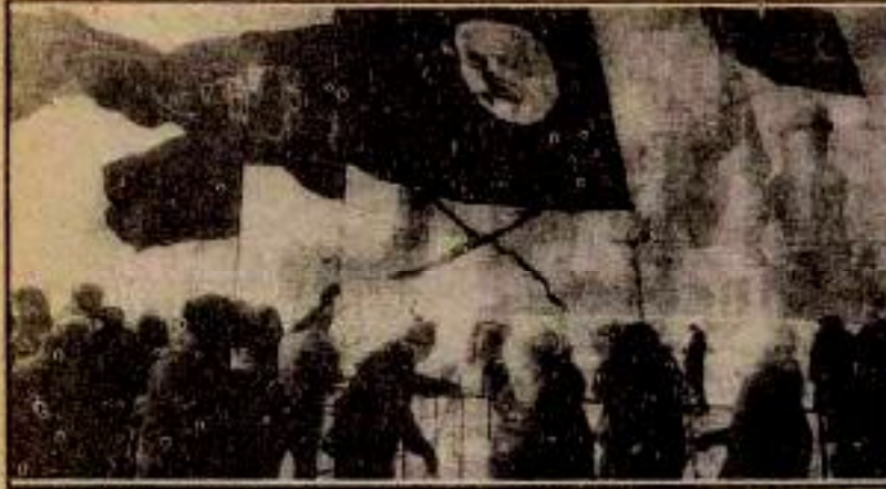
İkili iktidar sokaklarda kendini daha açık hissettiriyor.

kir. Deneyler kitlelere çok şey öğretti. Onlar, şimdiye kadar ki yaşamlarını sosyalizme borçlu olduklarını anlamış durumdadılar. Bundan böyle hiç kimse kitleleri sosyalizmin kötü olduğuna ve kapitalizmin iyi olduğuna inandırmaz.