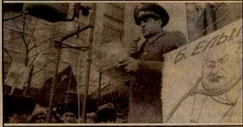
Sokaklardaki komünistler Yeltsin'in kellesini istiyorlar.

Politik yönetime gelen tüm kapitalizmyanlılarının tek yönelişleri kapitalizmdi. Politik yönetimin tüm olanaklarını bunun için kullandılar. Sonunda ne oldu. Onca çabaya, yasya rağmen kapitalizme dönebildiler mi? Kitleler sosyalizmi terk etmedi. Özel mülkiyeti teşvik için dttzinelerce yasa çıkardılar, teşvik ettiler. Tüm bunlara rağmen isteklerine ulaşamadılar. İsteklerini gerçekleştire-