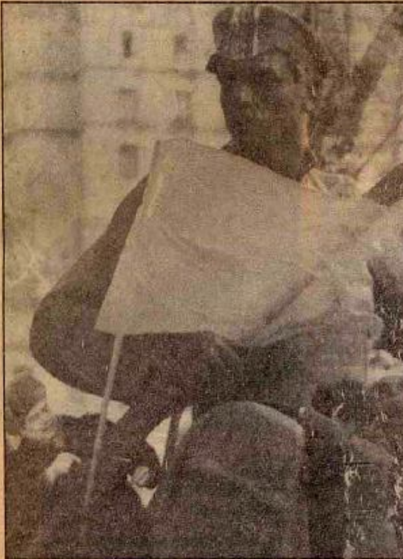
Ellerinde kazıl hayraklarıyla yine geliyorlar. Bu kez gütmemek üzere.

proleter kitlelerin komünist partilere olan güvenleri sarsıldı. Komünizm dünyasında tüm olup bitenler az şeyler değildi. Sözüü ettiğimiz komünist partilerin neden yıkıldıklarını daha önceki sayılarımızda belirttik. Burada söylenmesi gereken şey şudur: eğer komünist partileri komünizmin, marksizm-leninizmin temel öğretilerinden uzaklaşırlarsa, o partilerin yozlaşip, zamanla proletaryadan uzaklaşmaları, yıkılmaları