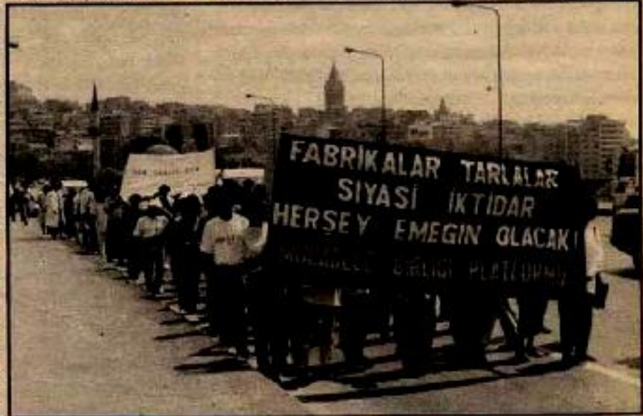
20 Temmuz Eyleminde Mücadele Birliği Platformu

Nesnel devrimci koşullar, reformist hareketlere öldürücü darbeyi indirerek onları kesin bir çöküş sürecine sokmuştur. Kendini düzen sınırları içine hapseden reformist akımlar bu öldürücü darbelerden kendilerini korumak için çareyi devrimci güçlerin gölgesinde sığınmakta buluyorlar. Bu çerçevede anlaşılacak kaydıyla, reformist akımların devrimci güçlerle yapmaya çalıştığı pek çok güç ve eylem birliği girişimine tanık olduk. Bu birliklerin bir kısmına yukarıda değindik. Ne var ki, şimdiye kadar reformist güçlerle oluşturulan platformlar, pasif bir konuma düştüğü gibi; bu platformlar ilerici unsurların devrimci eylemlere yönelmesini önünde de bir engel oluşturmuştur. Böylece, kapadan bin bir zahmetle kovulan reformist akımlar, gerçek dikkat göster-