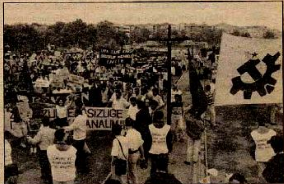
Sömür ve Zulme Karşı Güç Birliği Platformu'nun düzenlediği Kadıköy Mitingi

Haklar ve Özgürlükler Platformu'ndan dostlarımız hareketimizin geçmişine ilgili açık bulduklarını düşünüyor olmaları ki, sık sık geçmişimize atıfta bulunuyorlar. Öncelikle söylemeliyiz ki, hareketimizin geçmişinin tar-