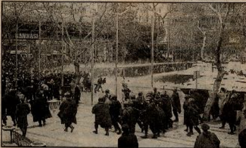
Ihanet cephesinin engellemeleri, kitlelerin önünde set olması devrimin zafere ulaşmasını önleyemeyecektir.

Hiç utanmadan, kendilerine "devrimci", "sosyalist", "ilerici" diyen bu hainler, işçileri bakanına çiçek sunarken, o sırada devrimciler, aynı bakanın emriyle işkence görüyorlardı. Halk düşmanı katiller sürüsünün başına geçip, devrimcilere yönelik açık infazları yöneten bu faşist bakana çiçek sunmak, devrimcileri susturmaya kalkmak, öldürülen insanlarımızı karşı işlenmiş ağır bir suçtur. Gazi ve Ümraniye sokak savaşları sırasında, eylemleri, anti-faşist gösteriye dönüşecek diye, eylemi erteleyerek devleti içine düştüğü zor durumdan kurtarmak, halka karşı işlenmiş en ağır suçtur. Halkların cellâdı CHP'yi, halk düşmanı faşist MHP'yi Kurultaya davet etmek, devletin yanında yer almaktır. Reformistler, halkların isyan ve ayaklanmasının önünde barikat olmakla kalmıyor, emekçilere karşı, burjuvazi ile birlik oluyorlar. Siz bütün dönemler, sermayenin önünde onur-