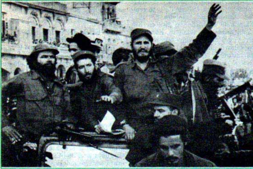
2 Ocak 1959 Fidel Castro Santiago de Cuba'ya giriyor.

Latin Amerika halklarını ayağa kaldırdığı için, devrim mücadelesinde onlara destek verdiği için, sosyalist varlığıyla büyük bir moral kaynağı olduğu için ABD emperyalizmi. Sosyalist Küba'ya karşı devamlı saldırı içinde oldu. Ama Küba onca saldırı, kuşatma, baskılara rağmen devrimci bir mevzi ve sosyalizmin sağlam kalesi olarak görevini tam 38 yıldır sürdürüyor.