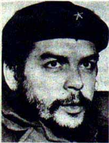
Küba Devriminin unutulmaz Liderlerinden Che Guevara