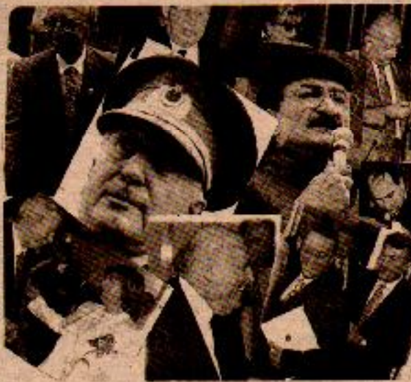
Bir değişik aralarında kesici sınıfsal tavarda birbirine karşı fark vardır!

Tekelci burjuvazi, emekçi sınıfların ve Kürt Halkının "sıttan gelen" devrim dalgasını kırmak için, önce kendi içinde bir karşı-devrim