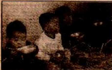
"... bir... er ya da geç Güney Kore'nin demokrasizasyonunun alınması."