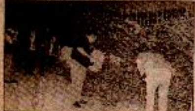
Devrimci haberciler polisten Yalvarık 700 devrimci haberciler İstanbul Harbiye Orduevi'nin bombalanması üzerine 2000 kişi sokaklara çıktı. Saldırıya ilişkin soruşturma ise devrimci gazetecilerin, devrimci yoldaşların tutulmasıyla başladı.

Gazete ve televizyon binalarına yönelik silahlı saldırılara her geçen gün bir yenisi daha eklenirken, önceki gece de İstanbul Harbiye Orduevi bombalandı. Saldırıda şans eseri ölen ve yaralı olmadı