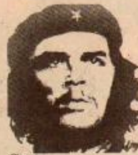
Che... DEVRİMLER SÜRÜYOR...

Sürdürmekte olduğumuz 'Che.. Devrimler Sürüyor' kampanyamız dahilinde hazırladığımız duvar afişlerimizi yapıştırmak için çıkan arkadaşlarımızdan dördü gözaltına alınarak Aksaray Terörle Mücadele Şubesine götürüldüler. İki okurumuz serbest bırakılırken diğer iki okurumuzdan halen haber alamamaktayız.