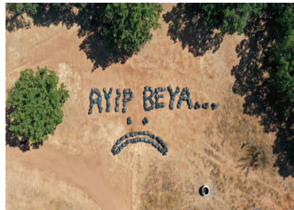
Ayıp Be Ya

Lüleburgaz Belediyesi'nde çalışan temizlik işçileri, hafta sonu piknik alanından topladıkları 150 torba çöpe Trakya usulü tepki gösterdiler. İşçiler topladıkları çöplerin poşetleriyle "Ayıp Be Ya" yazdılar.