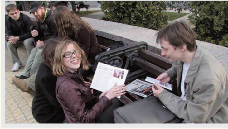
yan Bir Nesil

Bu ortaya çıkan yeni devrimci sol, politik yaşama uyanan ve büyük çoğunluğu 25 yıl önce Sovyetler Birliği'nin yıkılışı ve sancılı kapitalist restorasyon süreci sonrasında doğan genç nüfus arasında ve 35 yaşın altındaki genç yetişkinler arasında köklere sahip. Elbette sosyalist inşa döneminde yaşayan yaşlı kuşakların en iyi komünist unsurları da var [bu yeni hareketin içinde]. Bu [yaşlı kuşak], SSCB'nin düşüşünden sonra bile sosyalist ve anti-faşist eğilimlerin güçlü olduğu, metal işçilerinin ve madencilerin merkezi durumunda olan Donbas'ta özellikle belirgin.