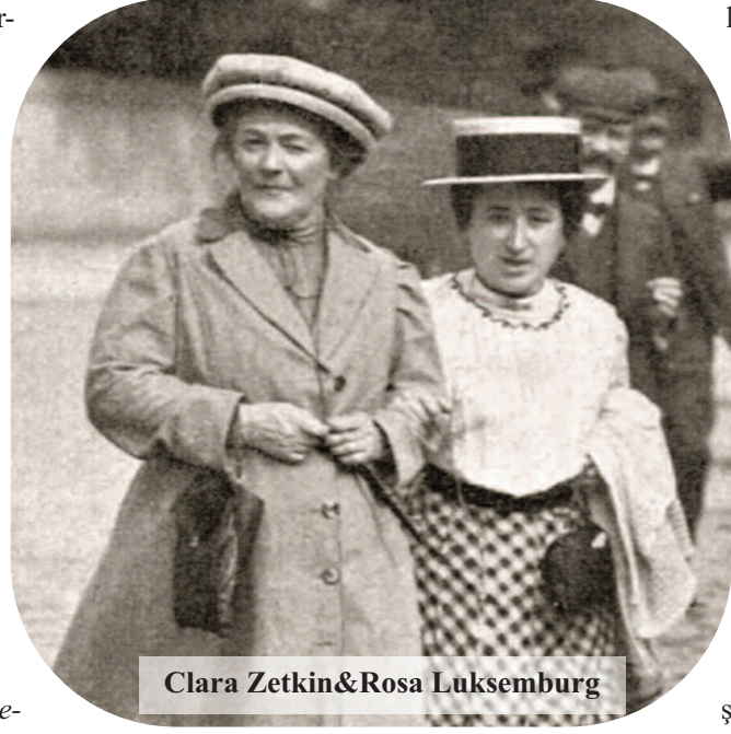
Clara Zetkin & Rosa Luxemburg

Feminist teori, kadınların özgürlüğünü cinsellik sorunlarına indirgeyerek, sınıfsal baskıyı ve sömürüyü gözardı ederek, kendi sınırlılığını gösterdi. Feminist-