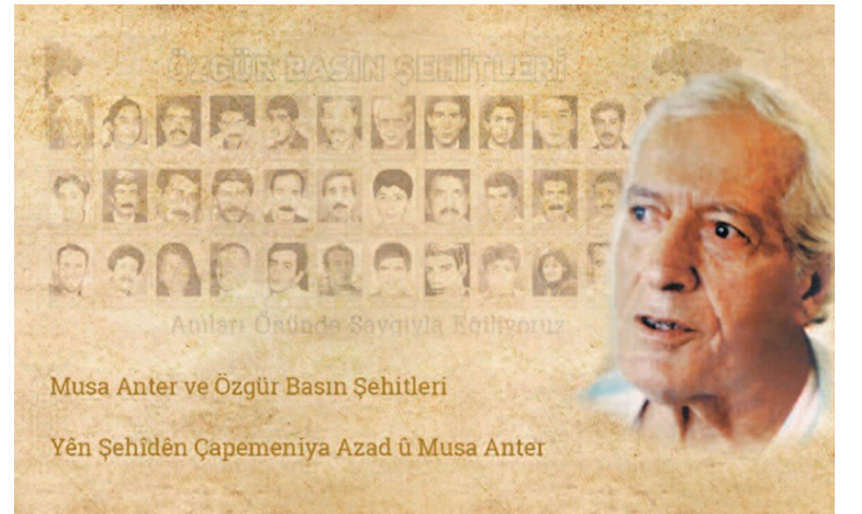
Musa Anter ve Özgür Basın Şehitleri

"Gerekirse ödülleri kapı kapı dolaşarak elden veririz, yasaklayamazlar" diyen gazeteciler adına Özgür Gazeteciler İnisyatifi Sözcüsü Hakkı Bolcan'ın sözleri, herkesin düşüncelerine tercüman oluyor: "Bizler bundan sonra da ödüllerimizi vereceğiz. Apê Musa'nın miras olarak bıraktığı özgür basın geleneğine el uzanmasına izin vermeyeceğiz. Bunu da bir el uzatma olarak görüyoruz. Bunun için daha fazla gazetecilik yapacağız. Haberleri yerinde daha güçlü izleyeceğiz. Apê Musa'nın istekleri doğrultusunda yapacağız. Bizler bundan sonra da Apê Musa'nın yarattığı paradigma ruhu ile hareket edeceğiz. Haber nerdeyse biz ordayız. Haber ve özgür basın biridir. Kimse onu birbirinden ayıramaz. Apê Musa ve Özgür Basın budur. Bizler, bu saldırının ve diğer bütün saldırıların teşhir etmeye devam edeceğiz."