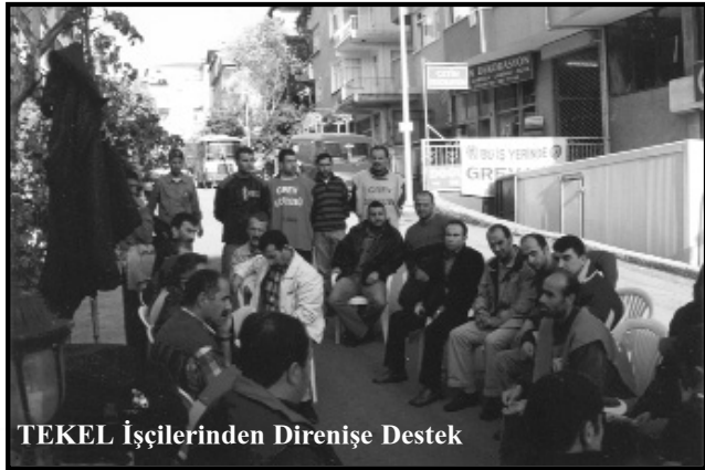
TEKEL İşçilerinden Direnişe Destek