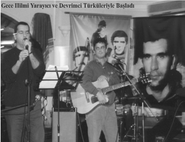
Gece Hilmi Yarayıcı ve Devrimci Türküleriyle Başladı

Saat 17.00’i gösterdiğinde, polisler artık etkinliği bitirip dağılmamızı söylediler. Bitmediği takdirde müdahale edileceğini öne sürdüler. Bizler de son grubun sahneye çıkacağımızı, o çıkmadan bitiremeyeceğimizi söyledik. Üzerimizde baskı kurup geri adım atacağımızı düşünerek gözaltı tehdidi yapan polisler, kararlılığımız karşısında bir şey yapamadı. O sırada sloganlarla birlikte Grup Munzur sahneye çıktı. Etkinlikte bulunan kitle öfkesi kabarmış, yüreği daha da bilenmiş olarak ayrıldılar salondan. Gece sonunda, Filistin, devrimci sloganlarla selamlandı. Artık hepimiz Filistinliydik. □