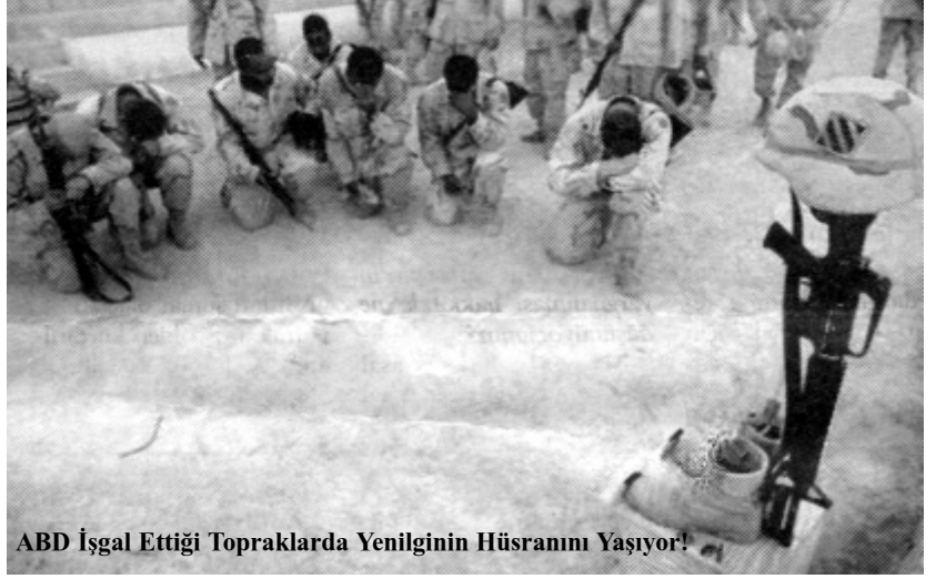
ABD İşgal Ettiği Topraklarda Yenilginin Hüsrânını Yaşıyor!

Sonrasında gelişen olaylar da bunu doğrular nitelikte. Federasyon düşüncesi yüksek sesle dile getirildi. G.Kürdistan'da bu doğrultuda adımlar atıldı. Ve ortaklık karıştı. Gösteriler, cinayetler, katliamlar hızla tırmandı. G.Kürdistan, özellikle de Kerkük ve Musul, çatışmaların merkezi oldu. Bu iki petrol kentinin karışması, ayrıca dikkat çekici!