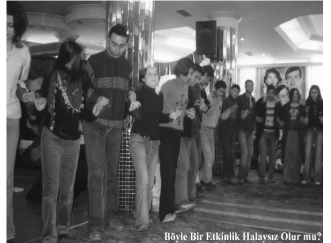
Böyle Bir Etkinlik Halaysız Olur mu?