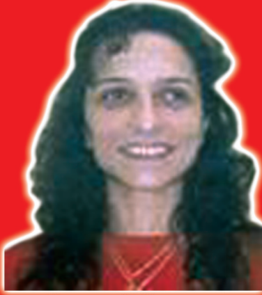
GÜNAY ÖĞRENER (DHKP-C)