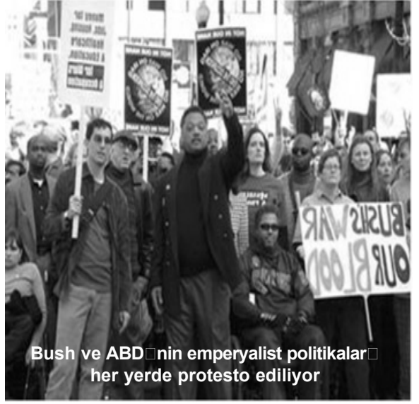
Bush ve ABD'nin emperyalist politikalar her yerde protesto ediliyor

ABD başkanı Bush, tıpkı kendisi gibi, Irak Savaşı öncesinde, Ortadoğu'da hangi ülkelerin bulunduğunu bile bilmeyen kongre üyelerine, "Büyük Ortadoğu Projesi" için çalışmalar başladıklarını duyurdu. Bu cehaletin arkasına sığınarak Pakistan, Afganistan, Fas, Tunus gibi ülkeler bile Ortadoğu olarak sunuldu.