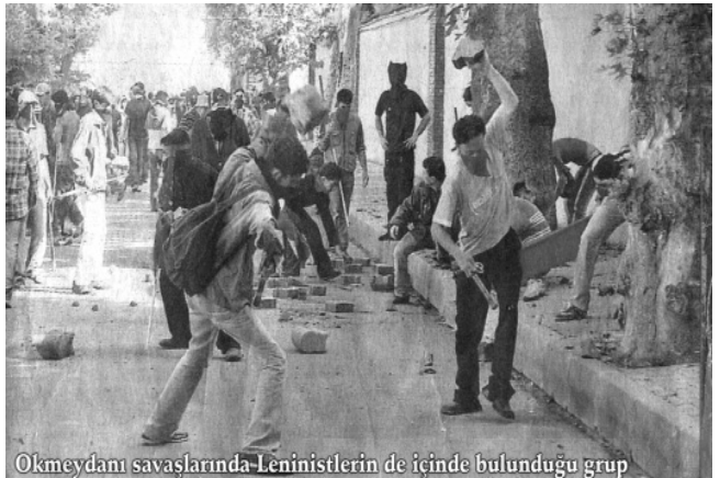
Okmeydanı savaşlarında Leninistlerin de içinde bulunduğu grup