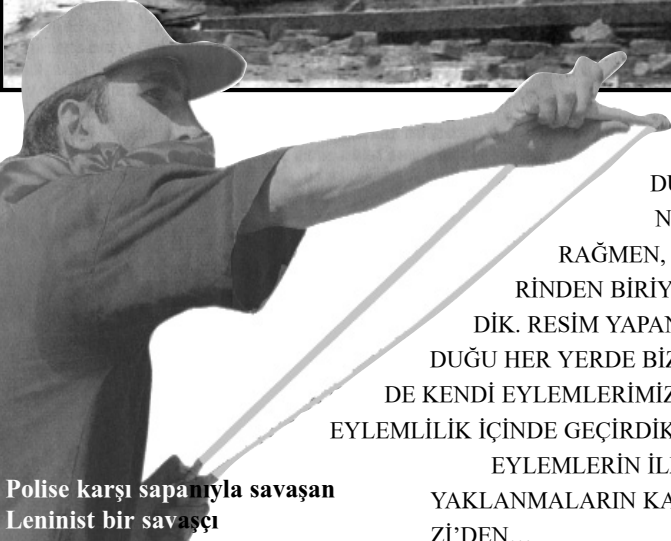
Polise karşı sapanıyla savařan Leninist bir savařçı

HALKLARIN KATİLİ NATO'YU DAĞITILIM SLOGANIYLA ÖNE ÇIKAN MÜCADELE BİRLİĞİ PLATFORMU OLDU.