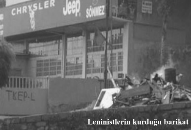
Leninistlerin kurduğu barikat