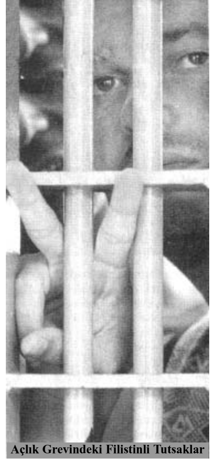
Açlık Grevindeki Filistinli Tutsaklar

Zindanlarda süren, artık tarihe mal olmuş bu eyleme karşı vahşice saldırıları da unutan reformizm; İsrail burjuvazisinin nasıl olup da açlık grevini sona erdirmek için “zindanların dışında mangal yakmak” işkencesini yapabildiğine inanmıyor. Bundan nutku tutuluyor; ama kimyasal silahlarla yakılmak, kurşunlara, bombalara hedef olmak, tecavüze uğramak, F tipi hücrelere kapatılmak, tek kişilik hücrelere yemek bırakmak, aylarca yemek yememiş insanlara zorla katı yiyecek yedirmeye çalışmak, zorla müdahale ederek sakat bırakmak, öldürmek gibi işkencelerin 19 Aralık’ta ve sonra-