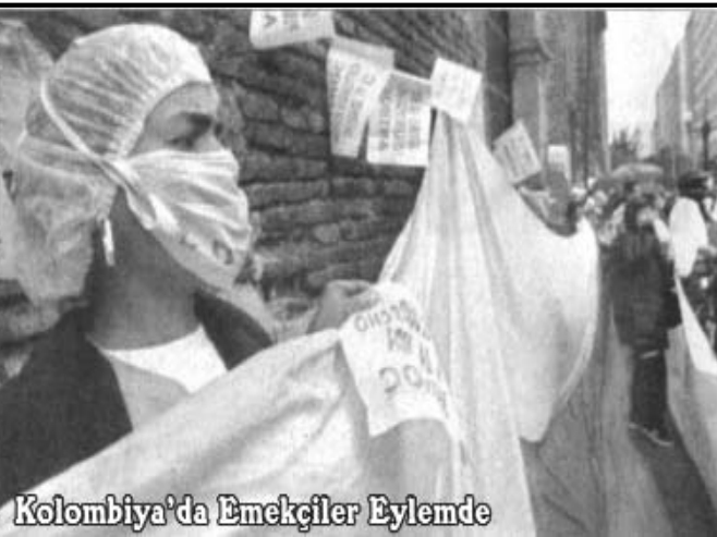
Kolombiya'da Emekçiler Eylemde

İşçi temsilcileri, Bush yönetiminin sadece Irak ve Afganistan'a değil, Amerikalı işçi ve emekçilere de savaş açtığını vurguladılar ve işçi haklarına yönelik saldırıları protesto ettiler. Ülkenin dört bir köşesinde eylem yapan emekçiler, seçimlere gün-