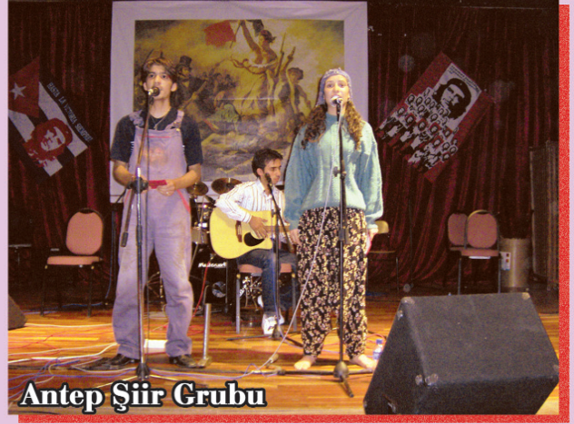
Antep Şiir Grubu