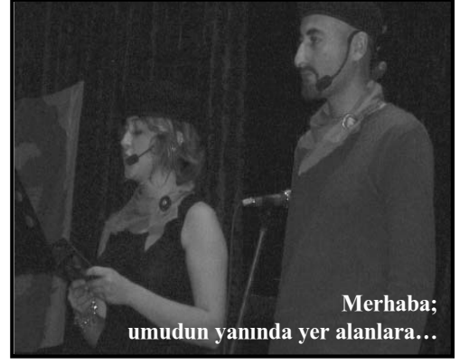
Merhaba; umudun yanında yer alanlara...

U zun soluklu bir çalışmanın sonucu olarak gerçekleştirilen Küba Dostluk Günü, 17 Ekim Pazar günü Kadırga Kültür Merkezi'nde yapıldı. Büyük bir coşkunlukla düzenlenen Küba Dostluk Günü, "Ellerimizi yalansız hürriyetin eliyle" buluşturmak üzere, Che şahsında tüm dünyada ölümsüzleşen devrim savaşçıları için yapılan saygı duruşuyla başladı.