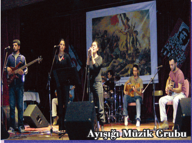
Ayışığı Müzik Grubu