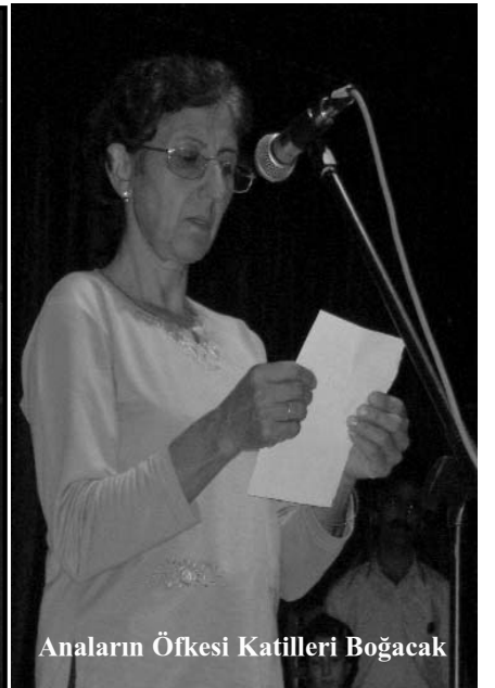
Anaların Öfkesi Katilleri Boğacak