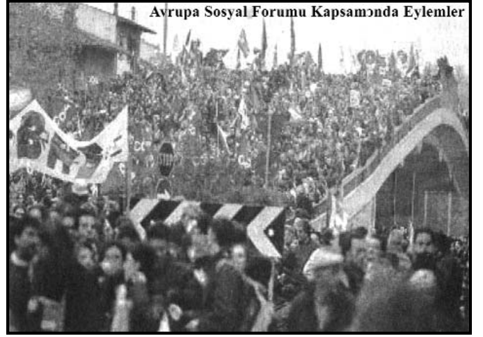
Avrupa Sosyal Forumu Kapsamında Eylemler

ler kala, Amerikalıların ülke içinde ve ülke dışında karşılaştıkları sosyal-ekonomik ve politik zorluklara dikkat çektiler.