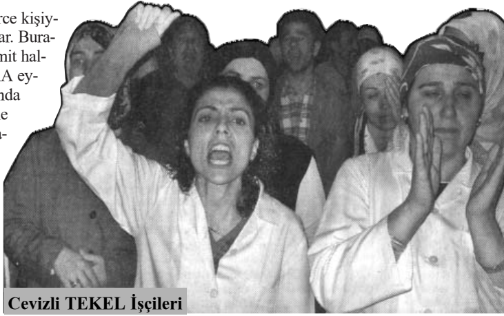
Cevizli TEKEL İşçileri

da, İzmit'in emekçileri binlerce kişiyle adeta polisi ablukaya aldılar. Burada politik bir çatışma var. İzmit halkı bir süredir izledikleri SEKA eylemine, böylesine kritik bir anda destek verecek kadar birikime sahip. Polis zoru ve genel olarak "zulüm", her gün kendi örneğini binlerce kez emekçiler üzerinde sergileyerek, halkın bir araya gelmesini hızlandıran "duygu birliği"ni yaratmıştır. Bu, ekonomik bir mücadelenin değil, politik bir mücadelenin birikimidir. Halkın, polis copları ve soludukları biber gazı karşılığında tasarruf ettikleri ve en kritik anda kullanıma hazır beklemedikleri mücadele birliğidir.