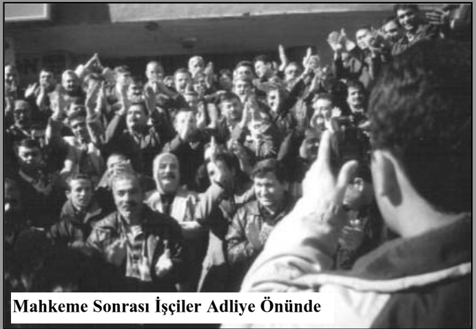
Mahkeme Sonrası İşçiler Adliye Önünde