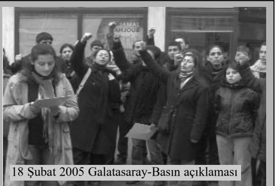
18 Şubat 2005 Galatasaray-Basın açıklaması

Üzerine binlerce düğüm atılmış bir sorunla karşı karşıyayız. Hem düğümleri tek tek çözeceğiz, hem de İskender’in kılıcıyla tek bir büyük darbe vuracağız. 8 Mart’ın kutlu olsun.