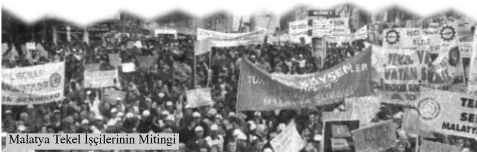
Malatya Tekel İşçilerinin Mitingi