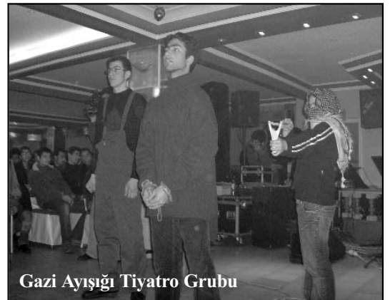
Gazi Ayışığı Tiyatro Grubu