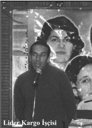
Lider Kargo İşçisi