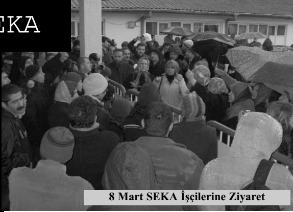
8 Mart SEKA İşçilerine Ziyaret