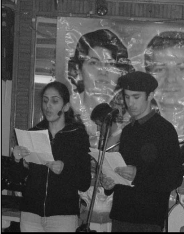
Grup Emeğe Ezgi