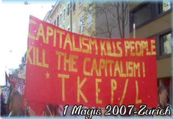
1 Mayıs 2007-Zurich