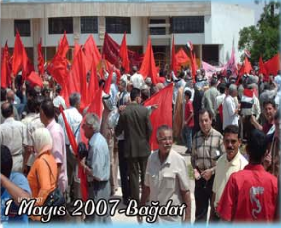
1 Mayıs 2007-Bağdat