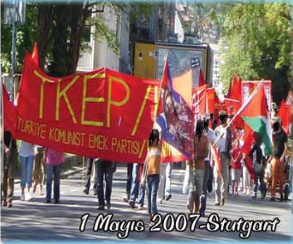
1 Mayıs 2007-Stuttgart