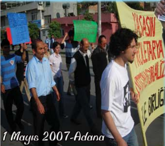
1 Mayıs 2007-Adana