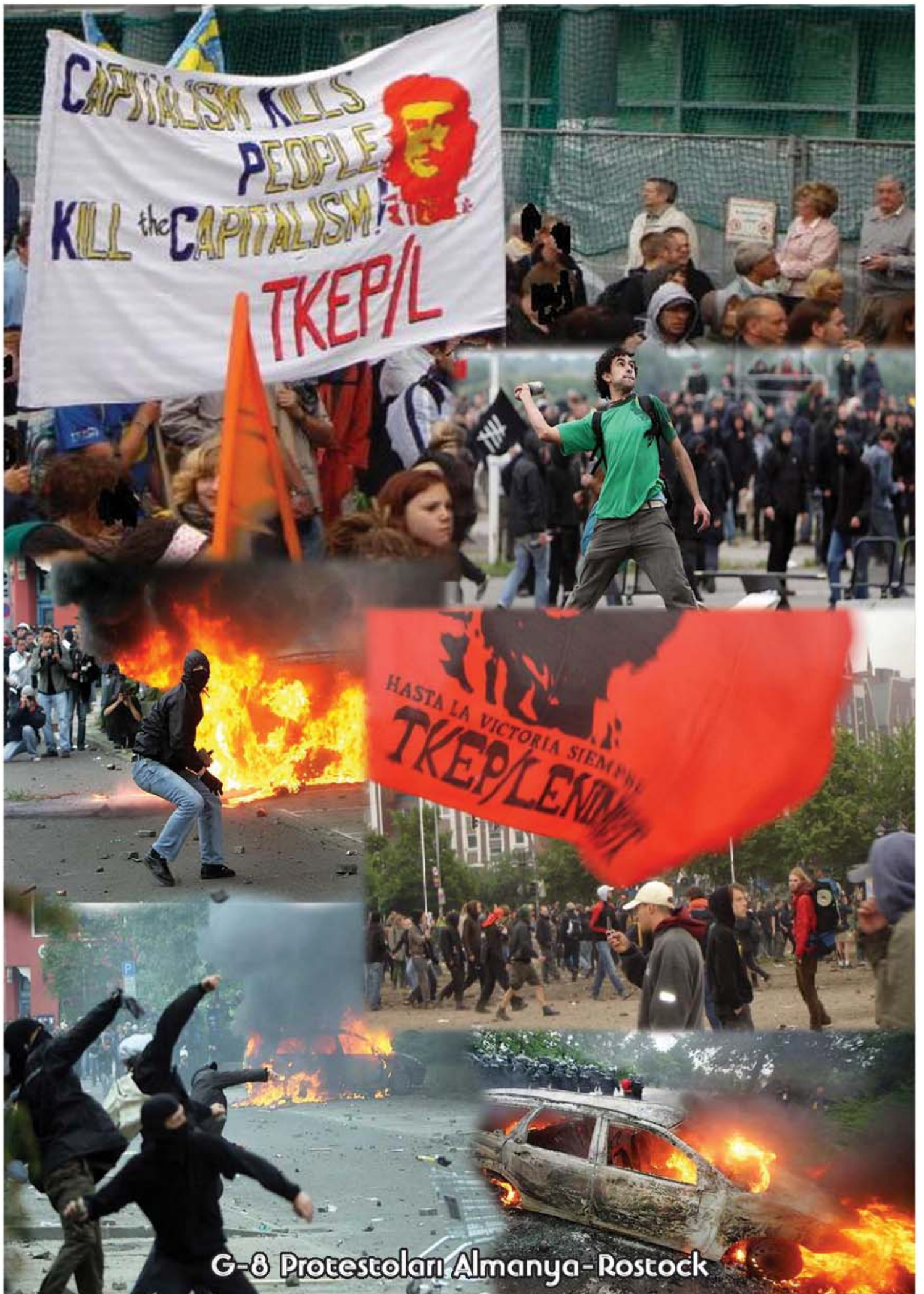
G-8 Protestoları Almanya - Rostock