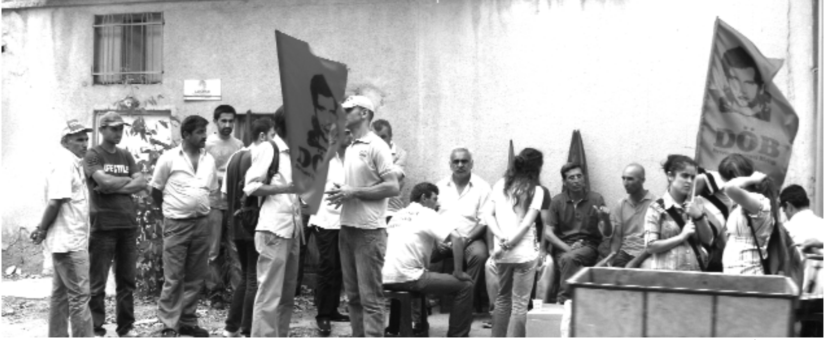
1 Haziran İzmir UPS

1 Haziran Salı günü Mücadele Birliği Platformu olarak 26 Nisan'da eylemlerine başlayan UPS işçilerini ziyarete gittik.