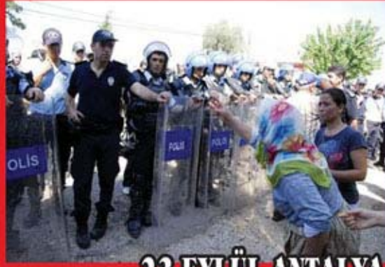
23 EYLÜL ANTALYA