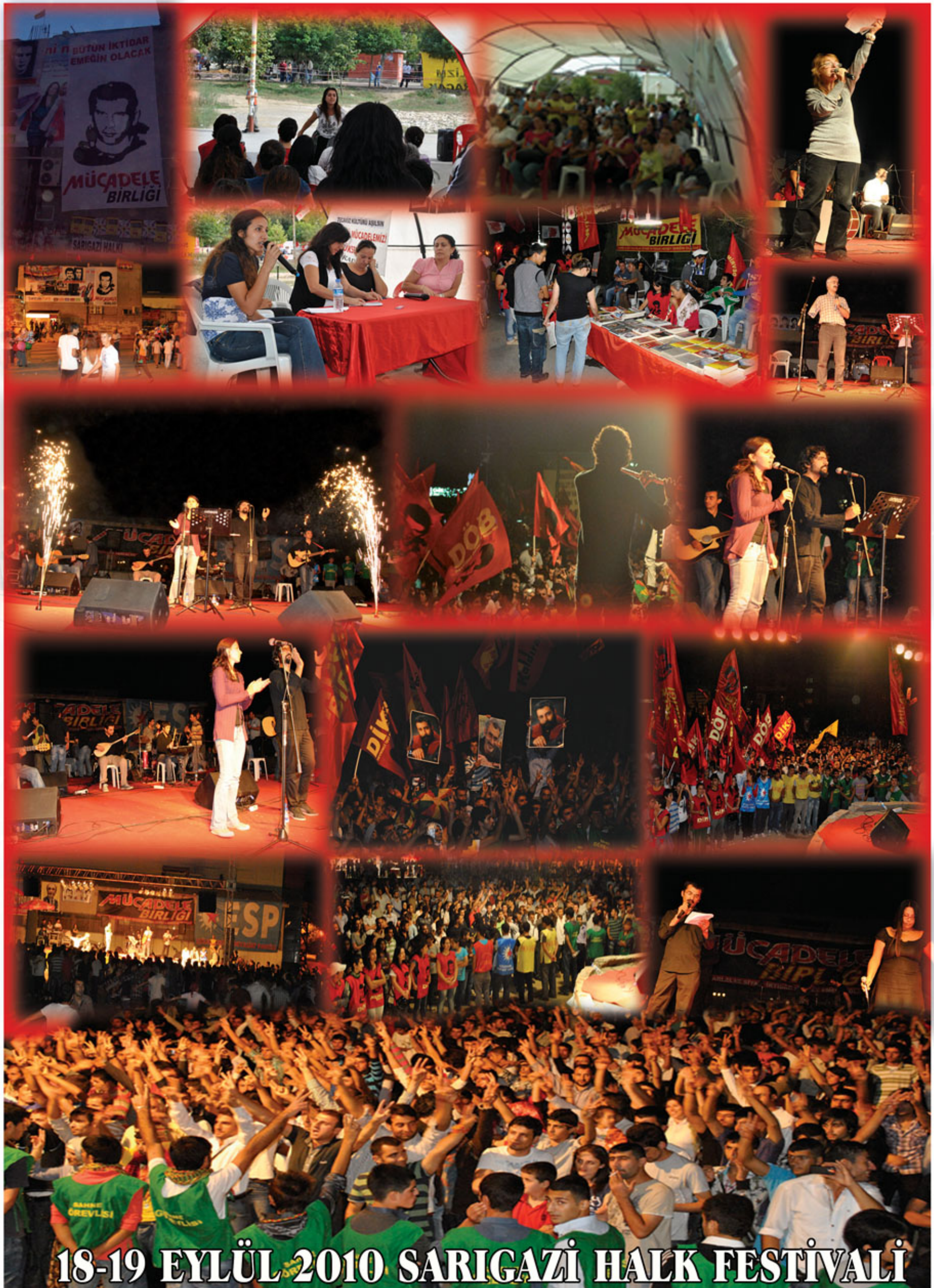
18-19 EYLÜL 2010 SARIGAZI HALK FESTİVALİ