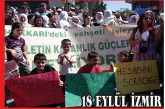
18 EYLÜL İZMİR