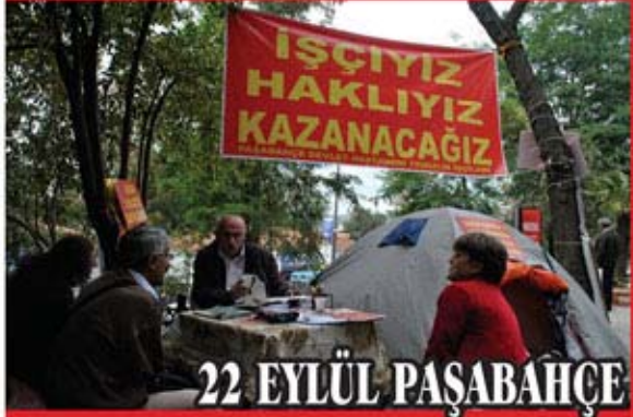
22 EYLÜL PAŞABAĞÇE