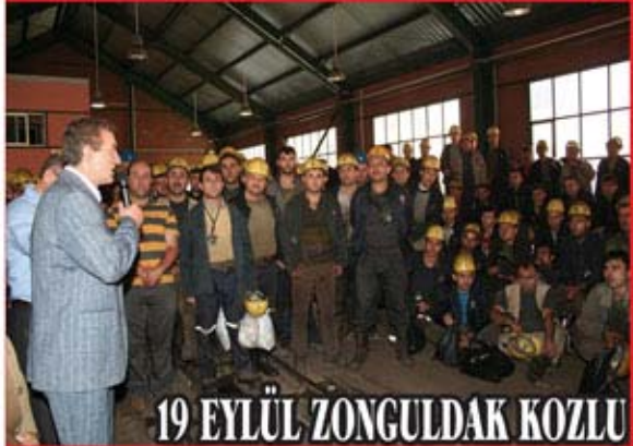
19 EYLÜL ZONGULDAK KOZLU