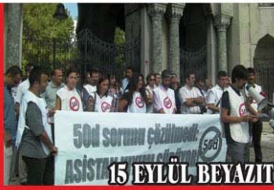
15 EYLÜL BEYAZIT