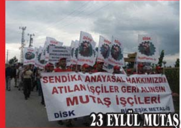
23 EYLÜL MUTAŞ