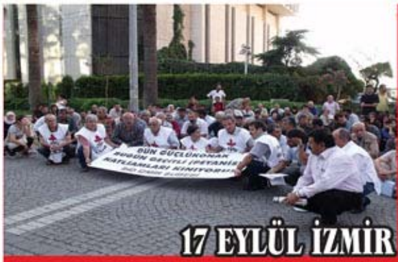
17 EYLÜL İZMİR