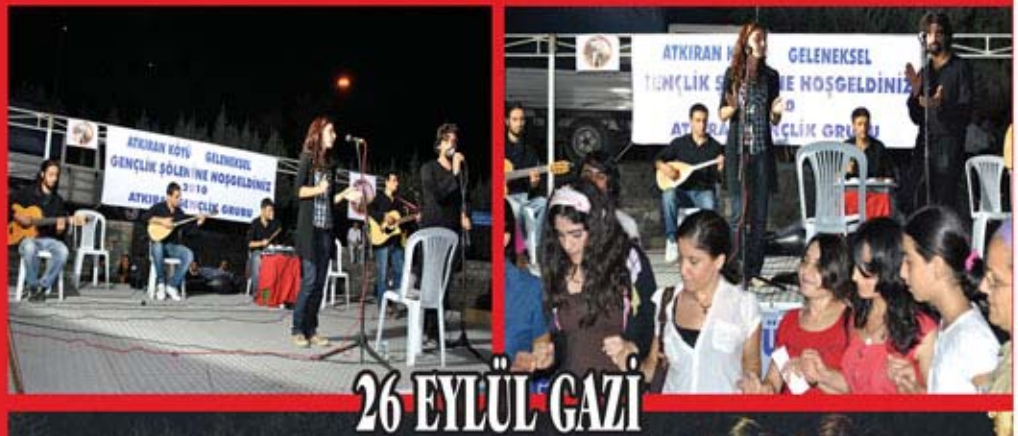
26 EYLÜL GAZİ