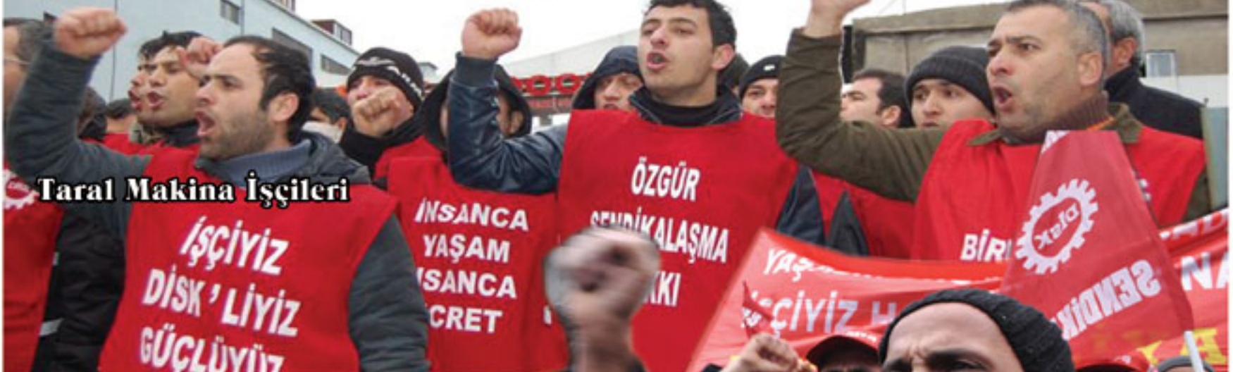
Taral Makina İşçileri