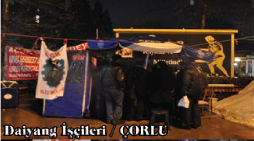
Daiyang İşçileri / ÇORLU

AVRUPA SERBEST BÖLGEDE YASALAR UYGUNSA GREV KIRICILIĞINA SON VERİLSİN DAIYANG - SK METAL İŞÇİLERİ