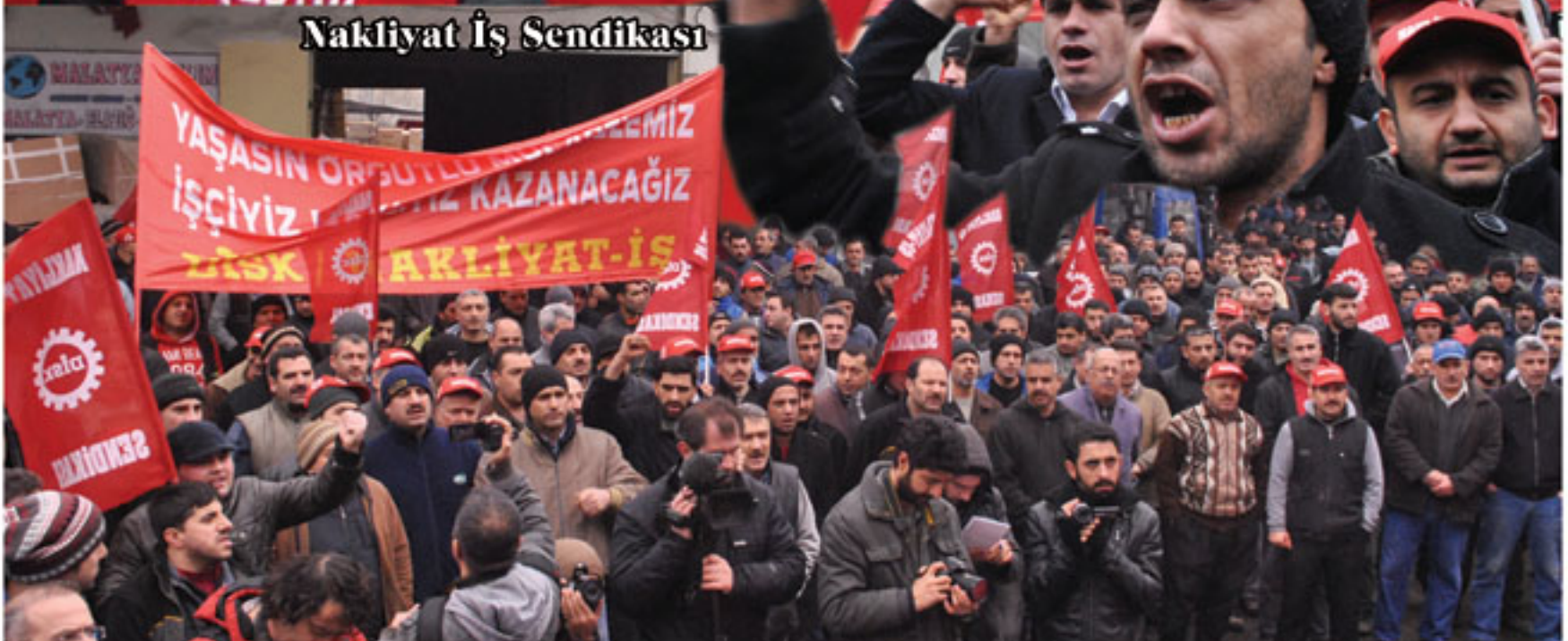
Nakliyat İş Sendikası