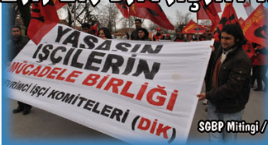
SGBP Mitingi / Lüleburgaz