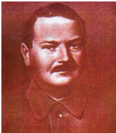
A. A. JDANOV SBKP Leningrad Örgütü Başkanı

"Yoldaşlar, Kızıl Ordunun üyeleri, subaylar, politik işçiler! Proleter devrimin beşiği Leningrad üzerinde düşman işgalinin doğrudan tehdidi sallıyor bugün. ... Boşa tek bir kelime harcamaksızın Leningrad'ı savunmak için Bolşevik özümüzü ortaya koyma zamanı gelmiş bulunuyor. Düşman kapıda! Bu bir ölüm kalım sorunudur!"