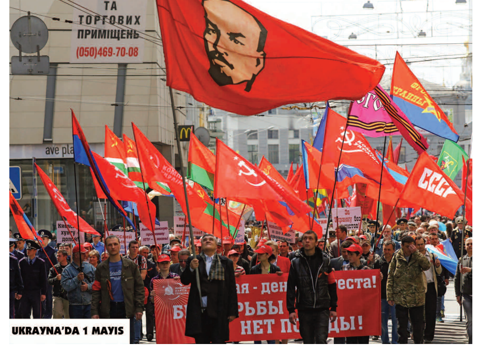
UKRAYNA'DA 1 MAYIS

olayların ilerici ve devrimci içeriğini görmeyenlere Lenin'in şu sözünü hatırlatalım: “Toplumsal devrimi sömürgelelerde ve Avrupa'da küçük ulusların ayaklanması olmadan, bütün önyargularıyla küçük-burjuvazinin bir kesimin devrimci patlaması olmadan, proleter ve yarı-proleter kitlelerin bilinçsiz politik hareketi olmadan... hayal etmek, toplumsal devrimi inkar etmektir. Sanki bir ordu çıkacak 'biz sosyalizm için savaşıyoruz' diyecek, bir diğeri de 'biz emperyalizm için savaşıyoruz' ve sonra da toplumsal devrim olacak! Her kim ki 'saf' bir toplumsal devrim görmeyi umarsa onu asla göremeyecek. Böyleleri devrimi hiç anlamadan devrim lafızını geveleyen kimselerdir.