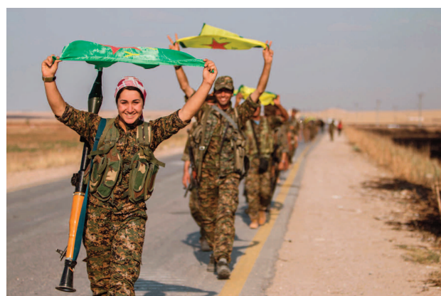
(Leylaların bayrağı dalgalanmaya devam ediyor genç kadınların ellerinde)