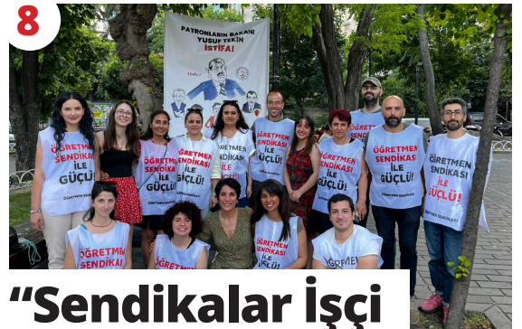
8 "Sendikalar İşçi Sınıfının Okullarıdır"