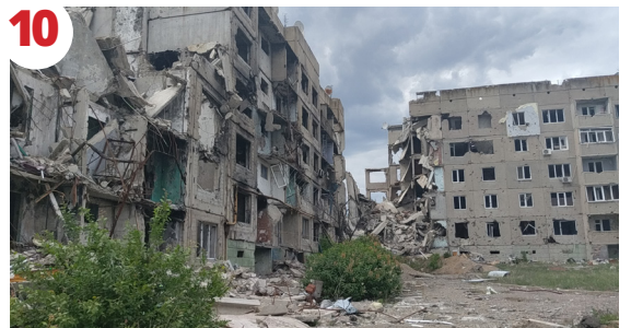
10 Donbass İzlenimleri -4