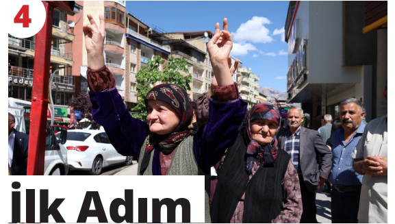
4 İlk Adım