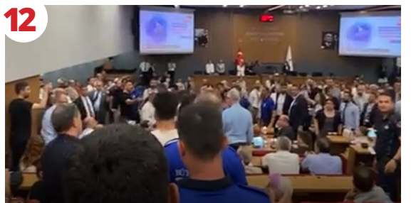
12 Hem Tel Aviv'le Hem Gazze ile "Kardeş" Olunmaz!