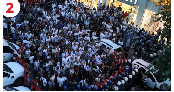
2 Kürdistan Faşizme Karşı