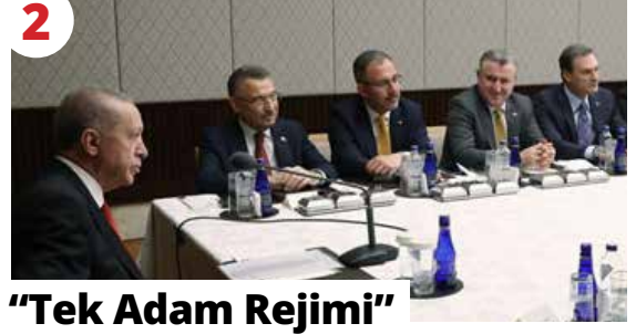
2 "Tek Adam Rejimi"

Bu kadar özensiz, izansız, bu kadar pişkin yalan söyleyiveriyorlar.