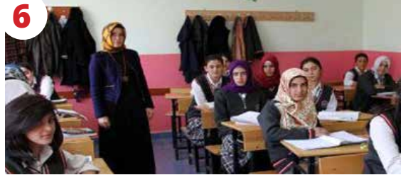
6 Türkiye Yüzyılı Maarif Modeli