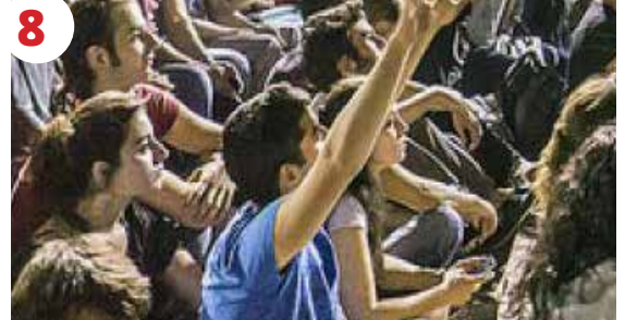
8 Yarını Belirleyecek Olan