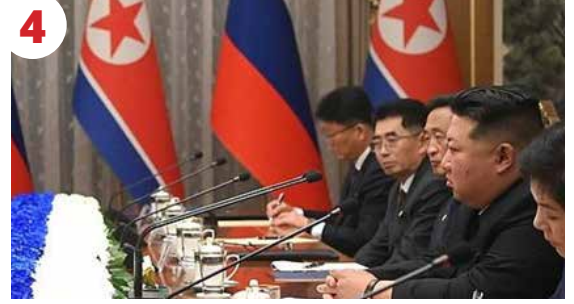
4 Emperyalizme ve Faşizme Karşı Birleşik Cephe İnşa Ediliyor