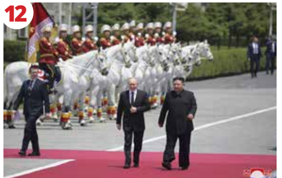
12 KDHC ve Rusya için Tarihi, Siyasi ve Diplomatik Zafer