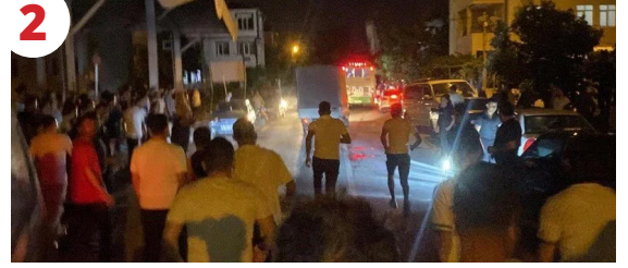
2 Dinci Faşist Çeteler ve "Mülteciler"

İki gündür yabancı düşmanı, göçmen karşıtı linç ayinleri düzenleniyor ülkenin dört bir yanında. Sözüm ona "halkın sabrı taşı" Suriyelilere, Afganlara karşı! Koca bir yalan! Sanki yıllardır ısrarlı bir propaganda yürütmediler göçmenlere karşı. En aşağılık şovenist ırkçı fikirler, açık Arap düşmanlığı, "şeriatçılığa karşıtlık" ve "Kemalist ilerçilik" adına boca edildi işçi ve emekçilerin üzerine. Özellikle de orta katmanların ideolojik yumuşak karınlarına...Bu topraklar linçlere aşınadır. Bu türden "toplumsal tepkilerin" ardındaki o karanlık eli, gerici faşist devleti gayet iyi biliriz. Mübadeleler, Aşkaleler, 6-7 Eylül, "ya Taksim ya ölüm"ler, 1964 Rum sürgünleri, 90'ların Ezine'si, Çan'ı ve daha nice... Türk burjuvazisi ve Türkiye kapitalizmi bu topraklardaki ulusal toplulukların serveti üzerine doğdu. Doğuşundan itibaren şovenist ve ırkçı temelde biçimlendi. Gericilik, onun genetik kodu oldu.