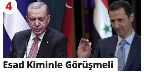
4 Esad Kiminle Görüşmeli