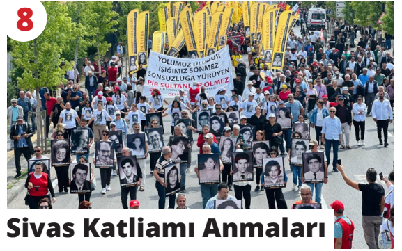
8 Sivas Katliamı Anmaları