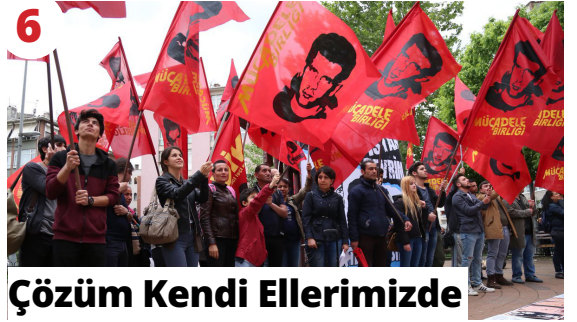
6 Çözüm Kendi Ellerimizde