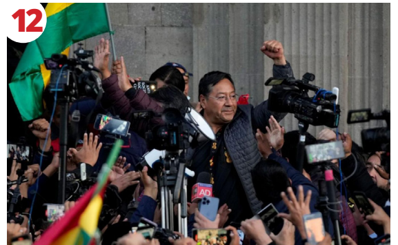
12 Bolıva: Kuzeyden Esen Rüzgarlarla Bir Darbe Girişimi