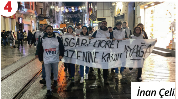
4 İnan Çeli Asgari Ücret: Emegın İtibarsızlaştırılması