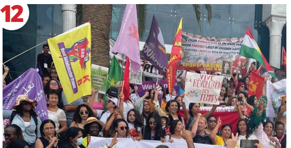
12 Dünya Kadınları Dayanışmaya Çağırıyor