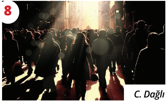
8 C. Dađlı Yeni Yarınlar İçin Başkaldırı