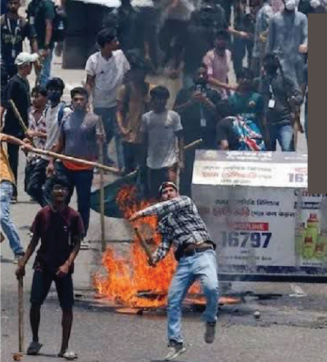
Temmuz 2024, Bangladeş

Siyonist İsrail'in Golan Tepeleri'nden çıkarılması tartışılırken Golan Tepeleri dahil, Şam'a yirmi kilometre yaklaşacak kadar, Suriye'nin çok daha geniş topraklarını işgal etmesi... Bunlar değil bir yıl önce, birkaç ay önce dahi kimsenin aklına gelmeyecek gelişmelerdi.